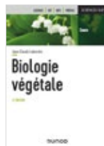
Biologie végétale Jean-Claude Laberche