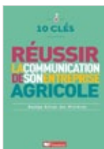
10 clés pour réussir la communication de son entreprise agricole Nadège Bellot des Minières