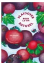
Plaidoyer pour le vin naturel Eric Morain, Sébastien Lapaque