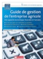
Guide de gestion de l'entreprise agricole Raymond Levallois