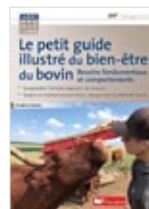
Le petit guide illustré du bien-être du bovin Pauline Garcia