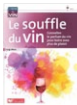
Le souffle du vin Luigi Moio