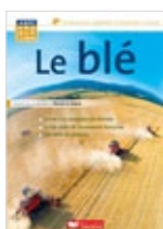
Le blé Hervé Le Stum