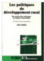
Les politiques de développement rural Paul Houé