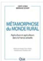
Métamorphose du monde rural Hervé Le Bras, Bertrand Schmitt